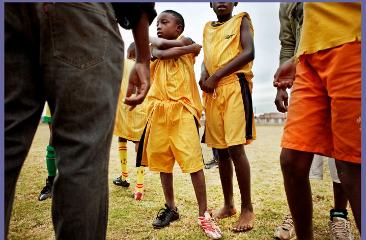
Kinder, Fußball, Schuhe, Mamelodi.